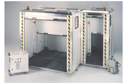
151322 Materialschleuse Quick-Dush