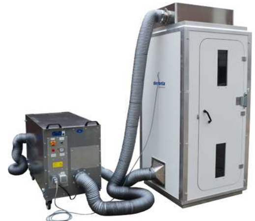
115321 Luftdusche Quick-Dush